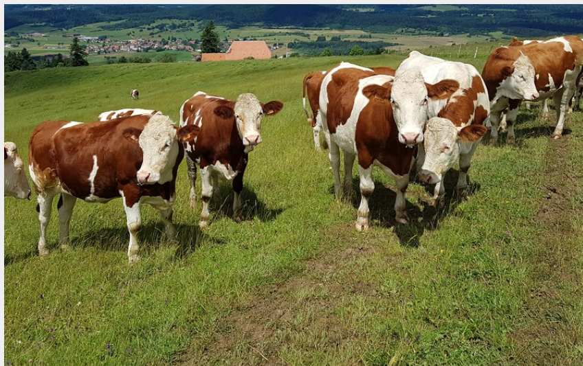
Les Oeillettes (Davy MOUGIN)