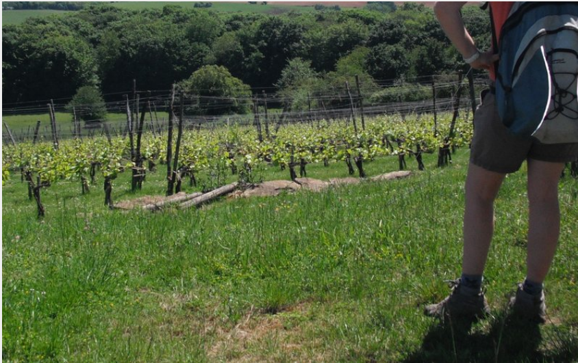
Vignes du Mouterot (OT Val Marnaysien)