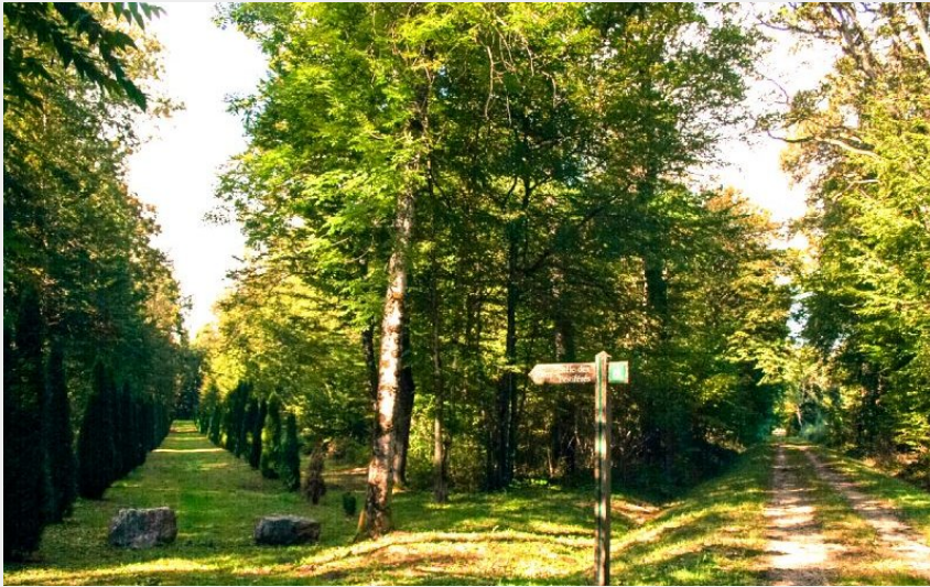
Cimetière des Pestiférés Recologne (OT Val Marnaysien)