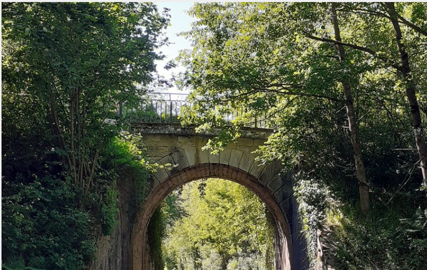
La Ligne des Escargots (OT Val Marnaysien)