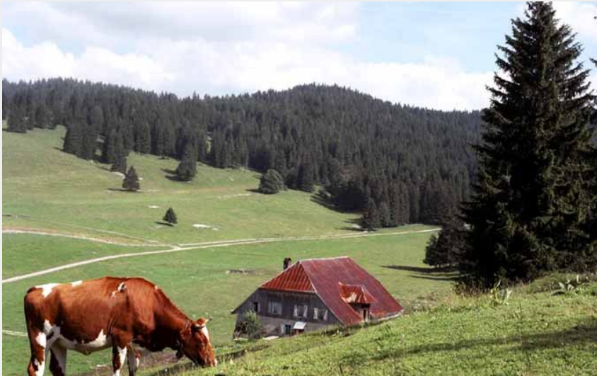
Paysage du Val de Mouthe