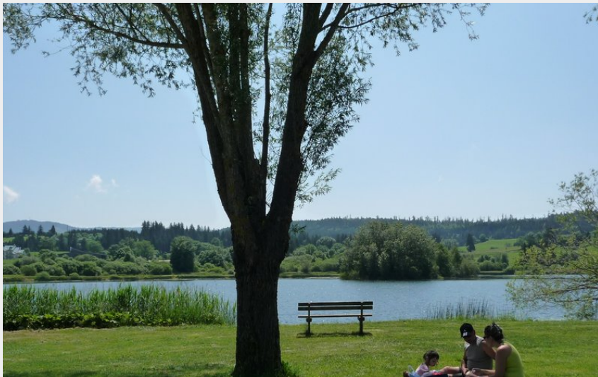
Lac de Remoray (Maud Humbert - OTHPHD)