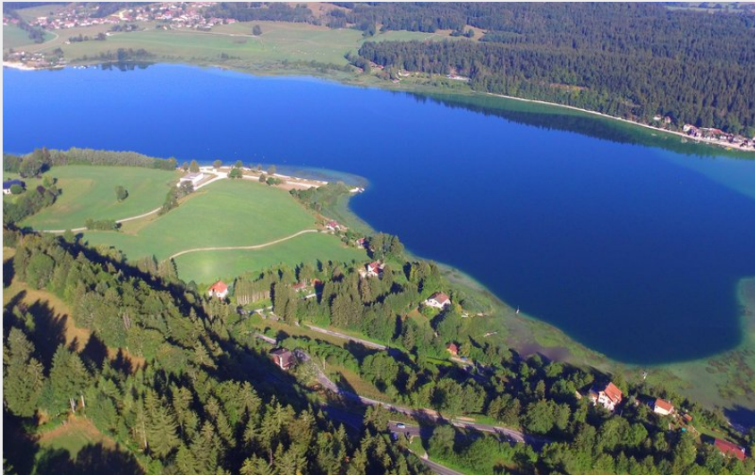
Le lac de Saint-Point en été (CVMA)