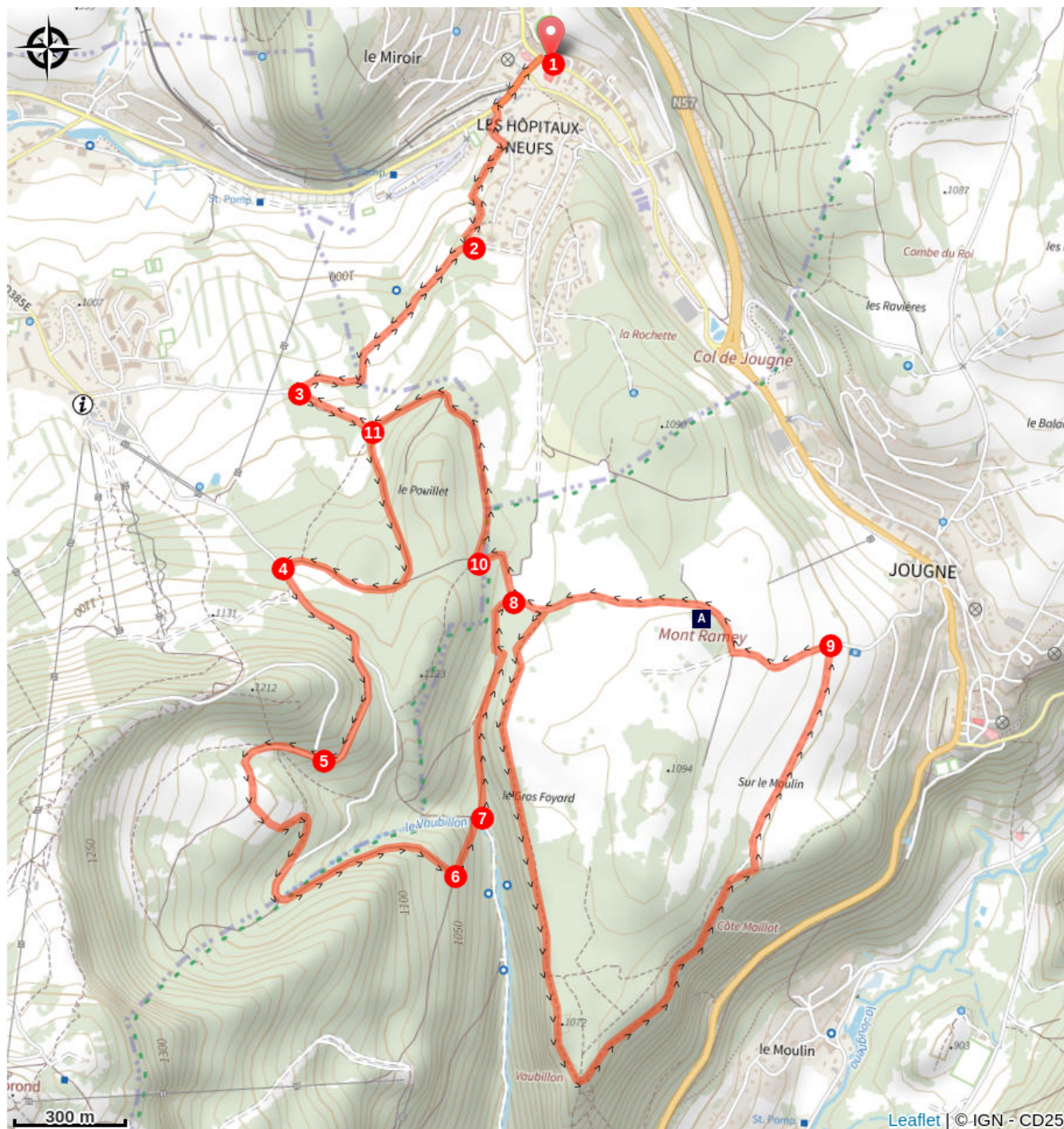
Redoute du Mont Ramey (A)