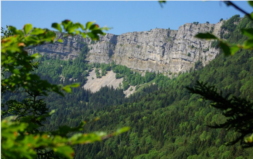
Vue sur les falaises du Mont d'Or depuis le Mont Ramey (Paul Verniau - OTHPHD)