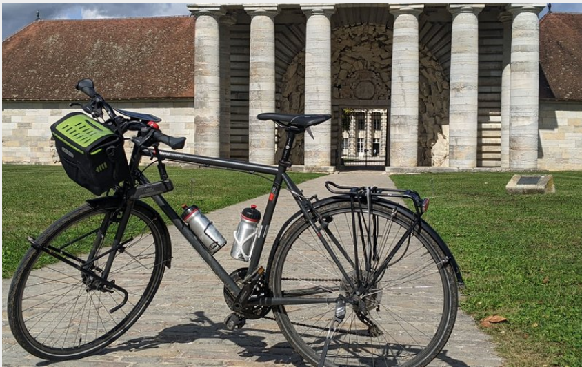
Arrivée à la saline