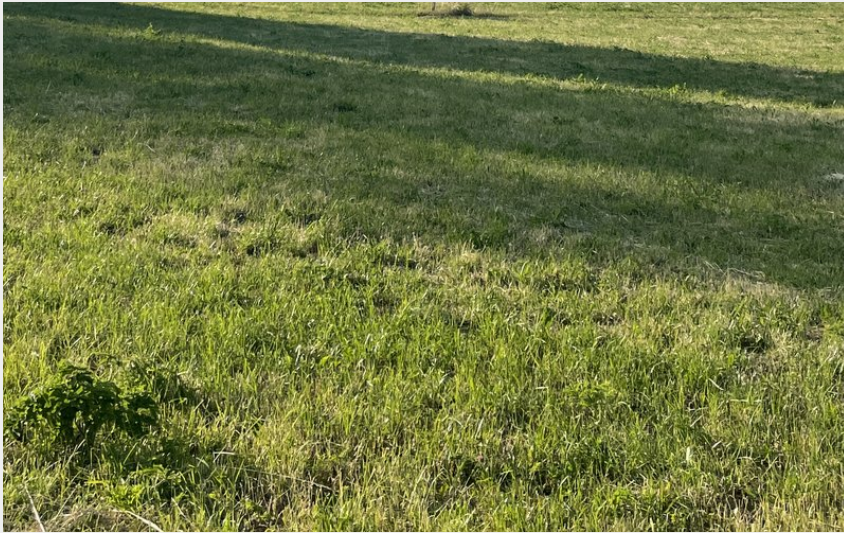
Grange comtoise avec son tuyé (POC Studio)