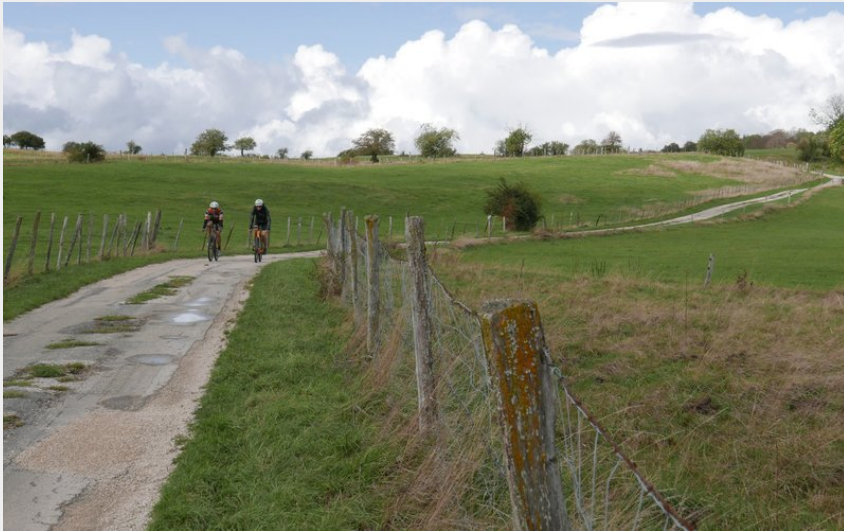
Vallée du Dugeon (POC Studio)