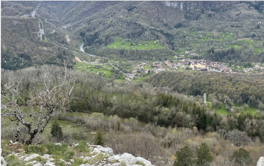
Panorama de la Haute Vallée de la Loue (POC Studio)