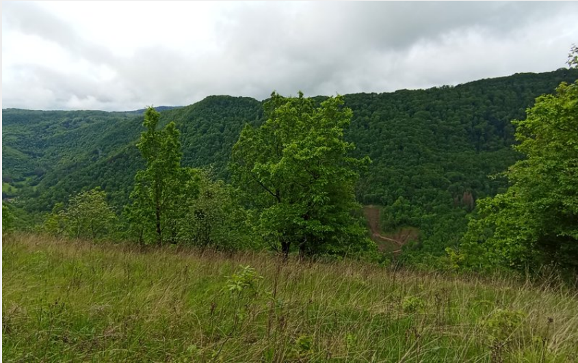
Point de vue sur la vallée de la Loue (Lionel ROBERT)