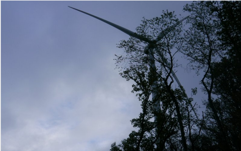
Les éoliennes du Doubs central (POC Studio)