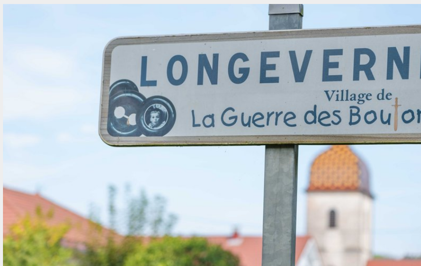
Longeverne, village de la Guerre des Boutons (Maxime Naegely)