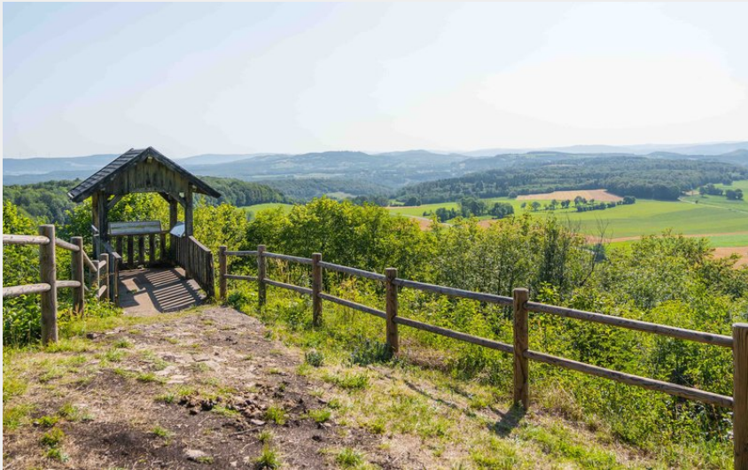
Belvédère du Peu - Laviron (Maxime Naegely)