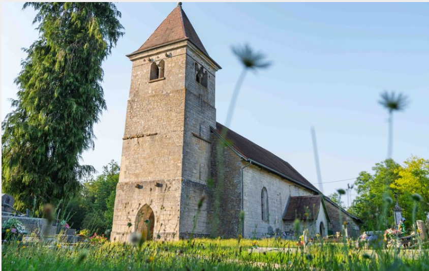
Église de Leugney (Maxime Naegely)