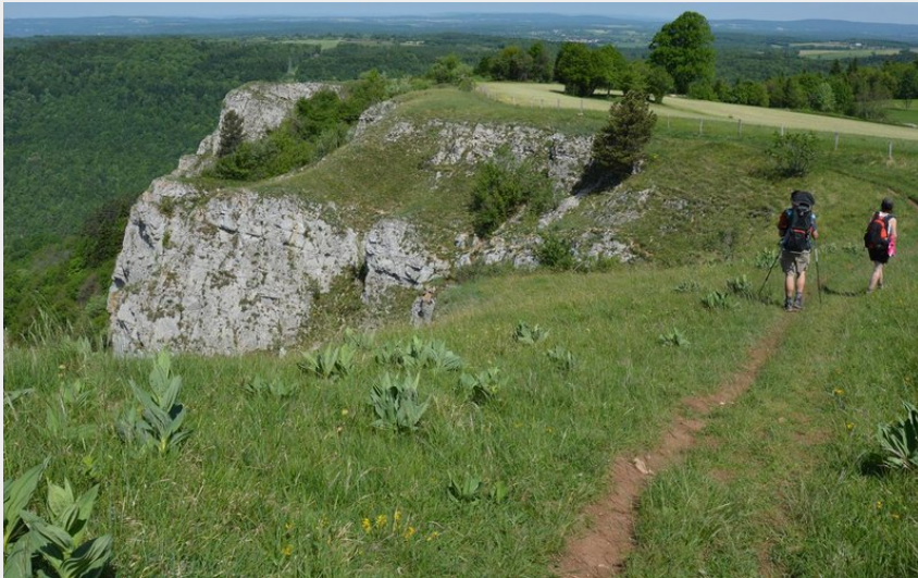
Sentier de la Roche de HautePierre