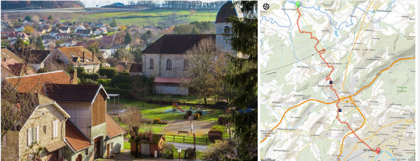
Vue du village et de l'église