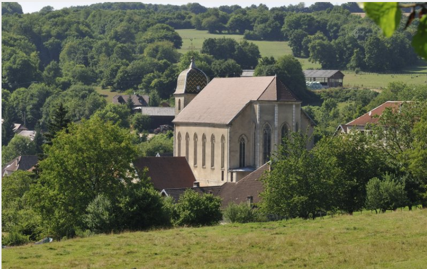
Village de Mancenans (Thierry BONDUELLE)