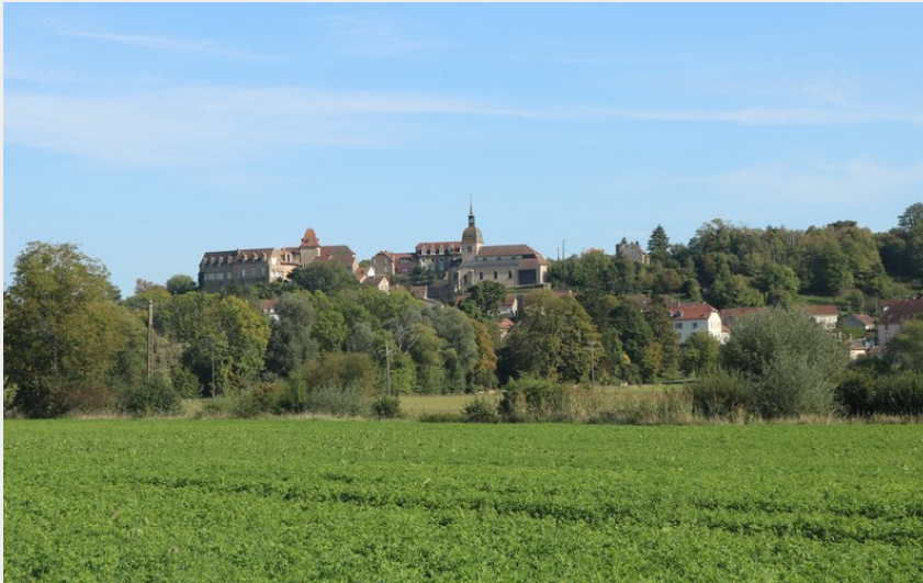
Le village de Rougemont