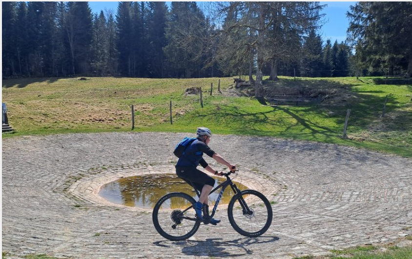
Lavogne sur le plateau