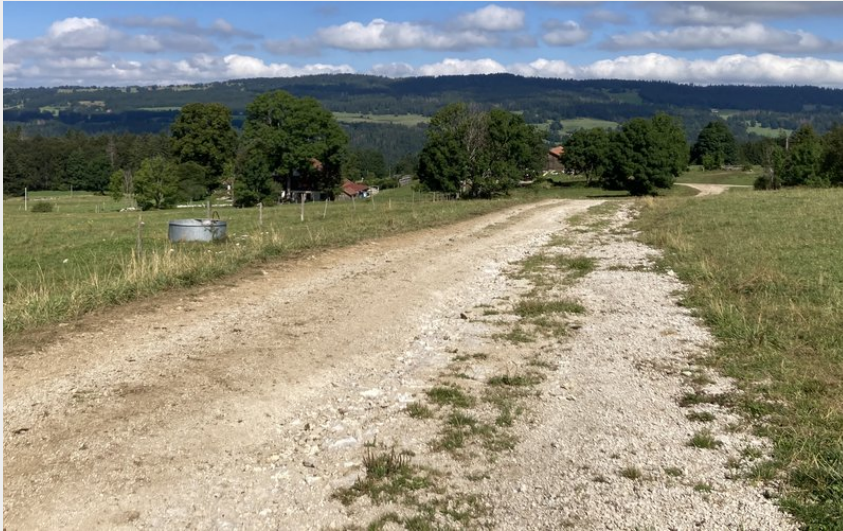
Vue sur la vallée des Verrières