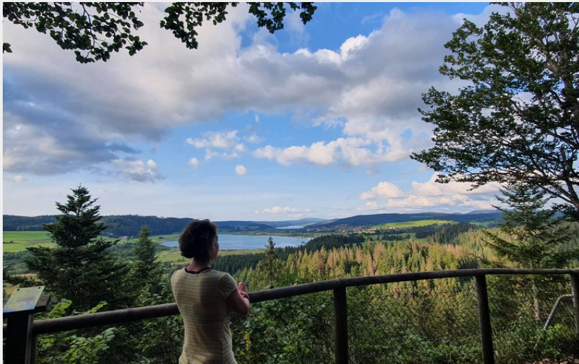
Belvédère des 2 Lacs