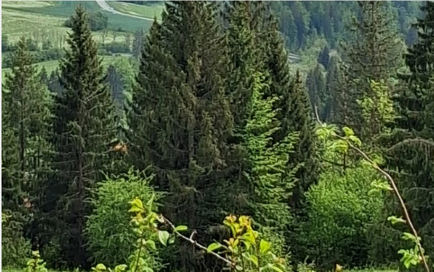
Vue sur le village de Oye et Pallet, lac Saint-Point et Mont d'Or (CCGP)