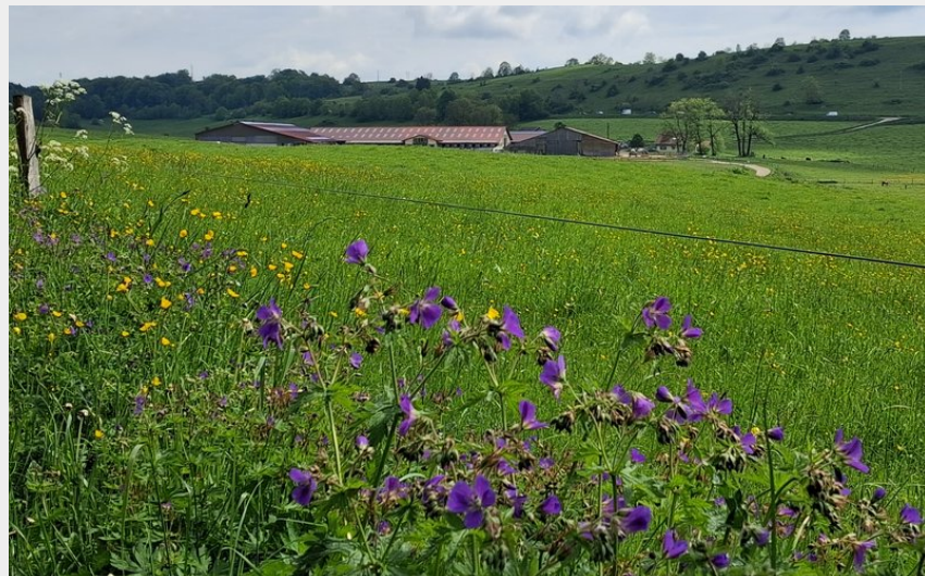
Ferme de Saint-Lazare centre équestre (CCGP)