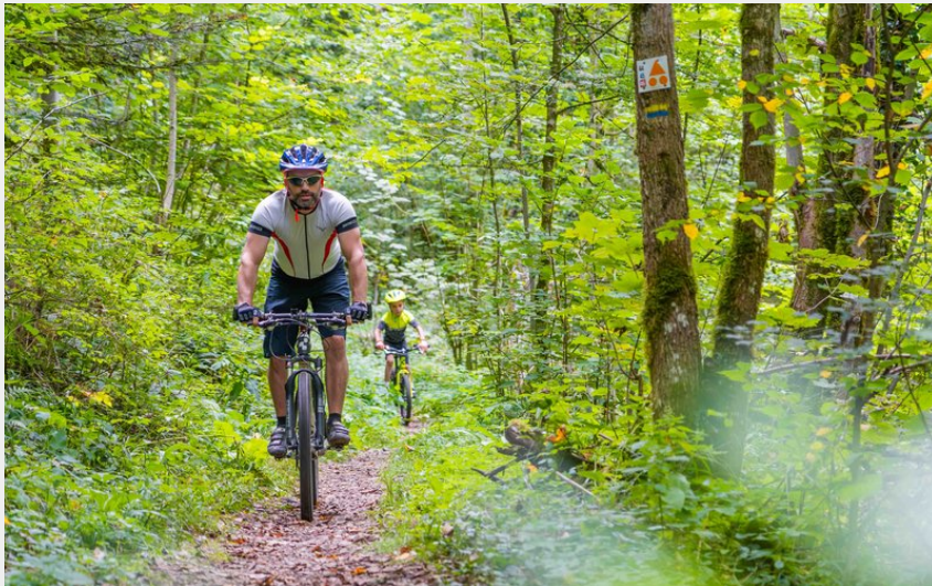
Sentier VTT la Rêverotte (Maxime Naegely)