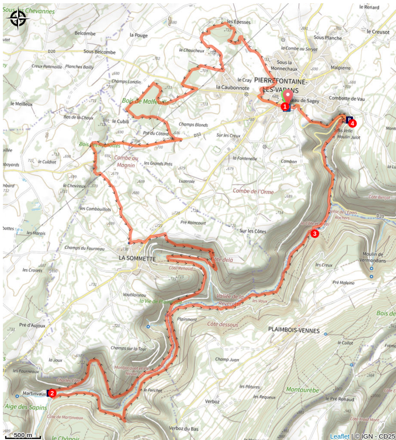
Puits de la Doye (A)