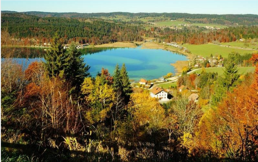
Lac de Saint Point en automne