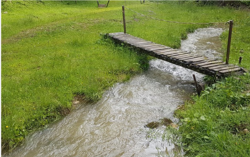
Pont en bois sur le ruisseau au Cernet de Doubs (Davy MOUGIN)