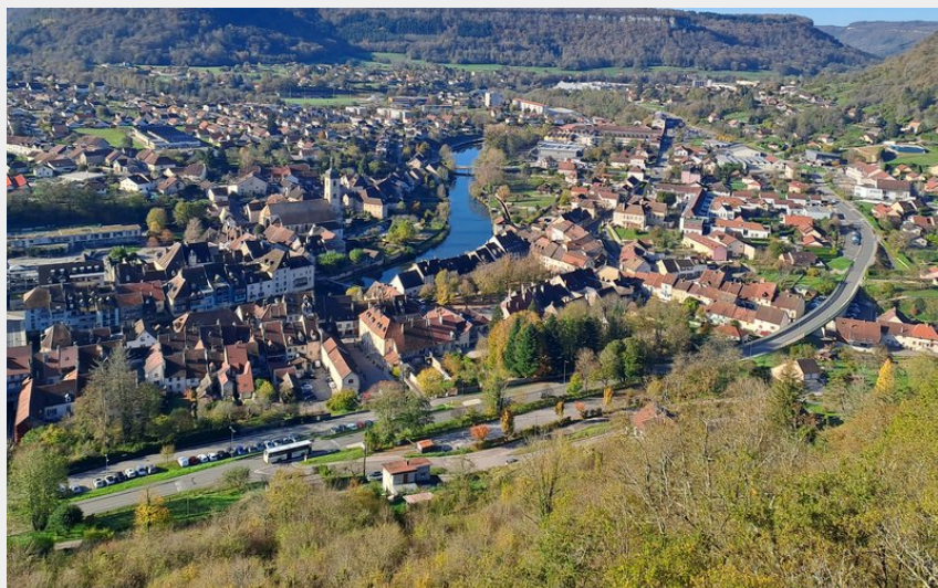
Point de vue sur Ornans depuis la Roche du Mont