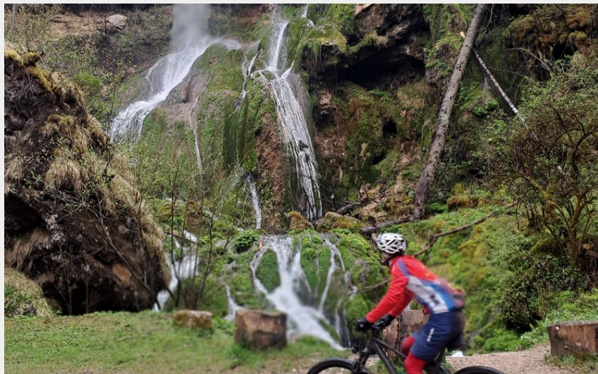
Cascade du Moulin de Vermondans