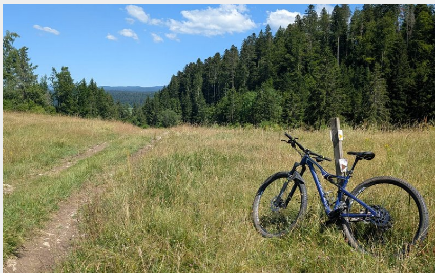
VTT Le Tarembert 3 (@CFD)