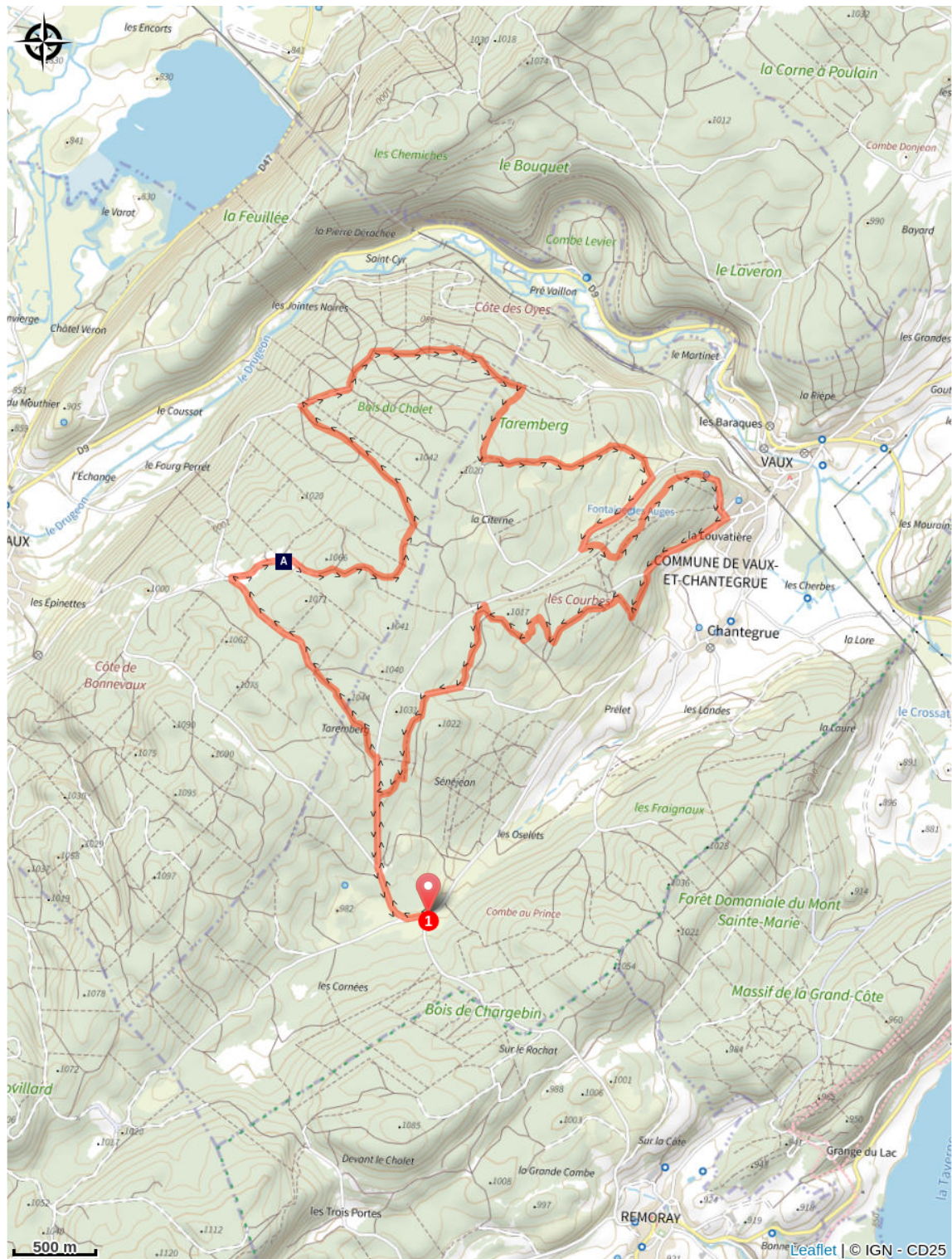
La vieille citerne (A)