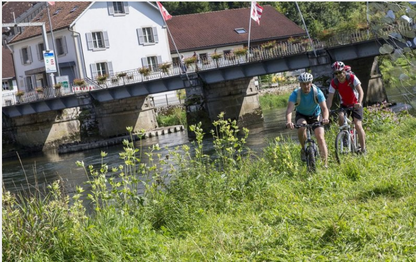
VTT vallon de Goumois, perle Franco Suisse (Laurent Cheviet)