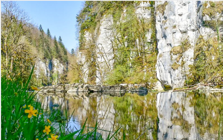
Gorges du Doubs (Loïc Renaud)