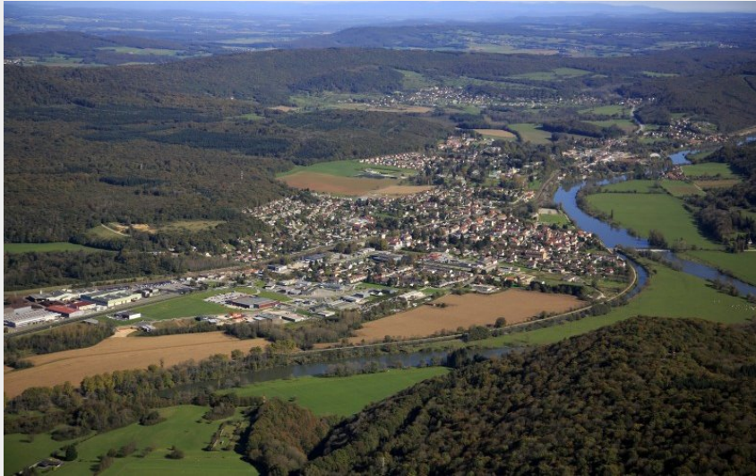
Vue aérienne de Roche-lez-Beaupré (GBM)