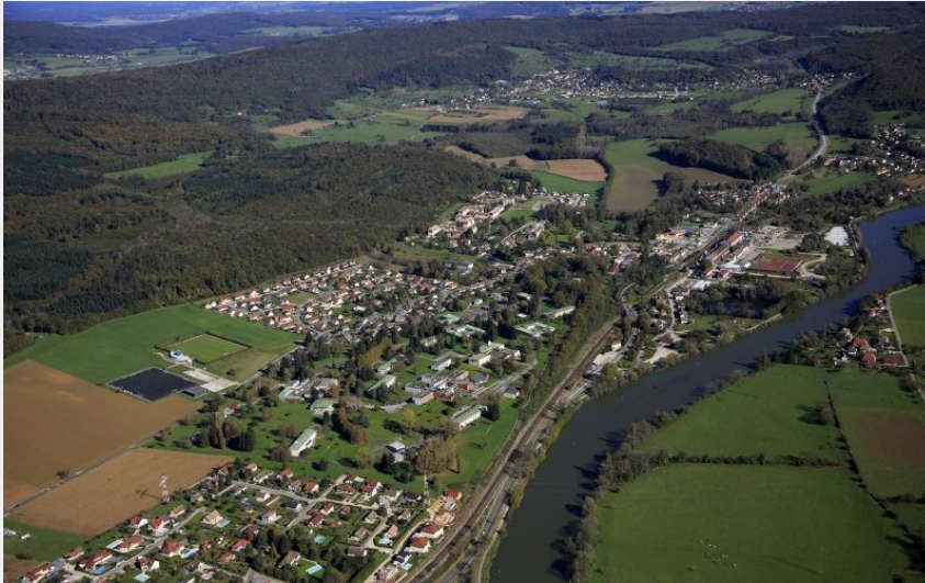
Vue aérienne de Novillars (GBM)