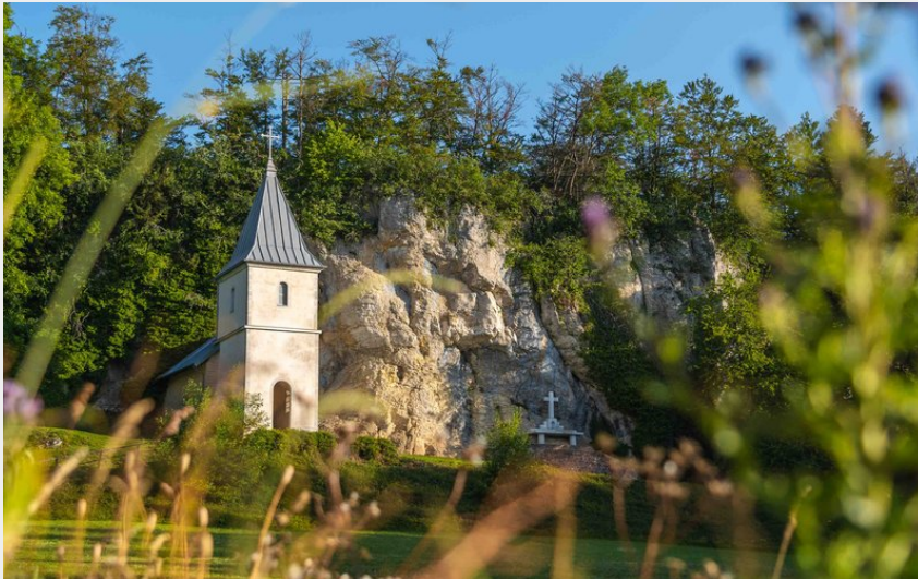
Chapelle Sainte-Radegonde (Maxime Naegely)