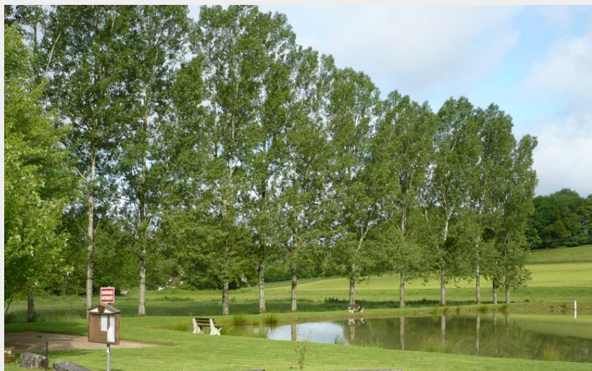
Étang de Verne (OT DOUBS BAUMOIS)