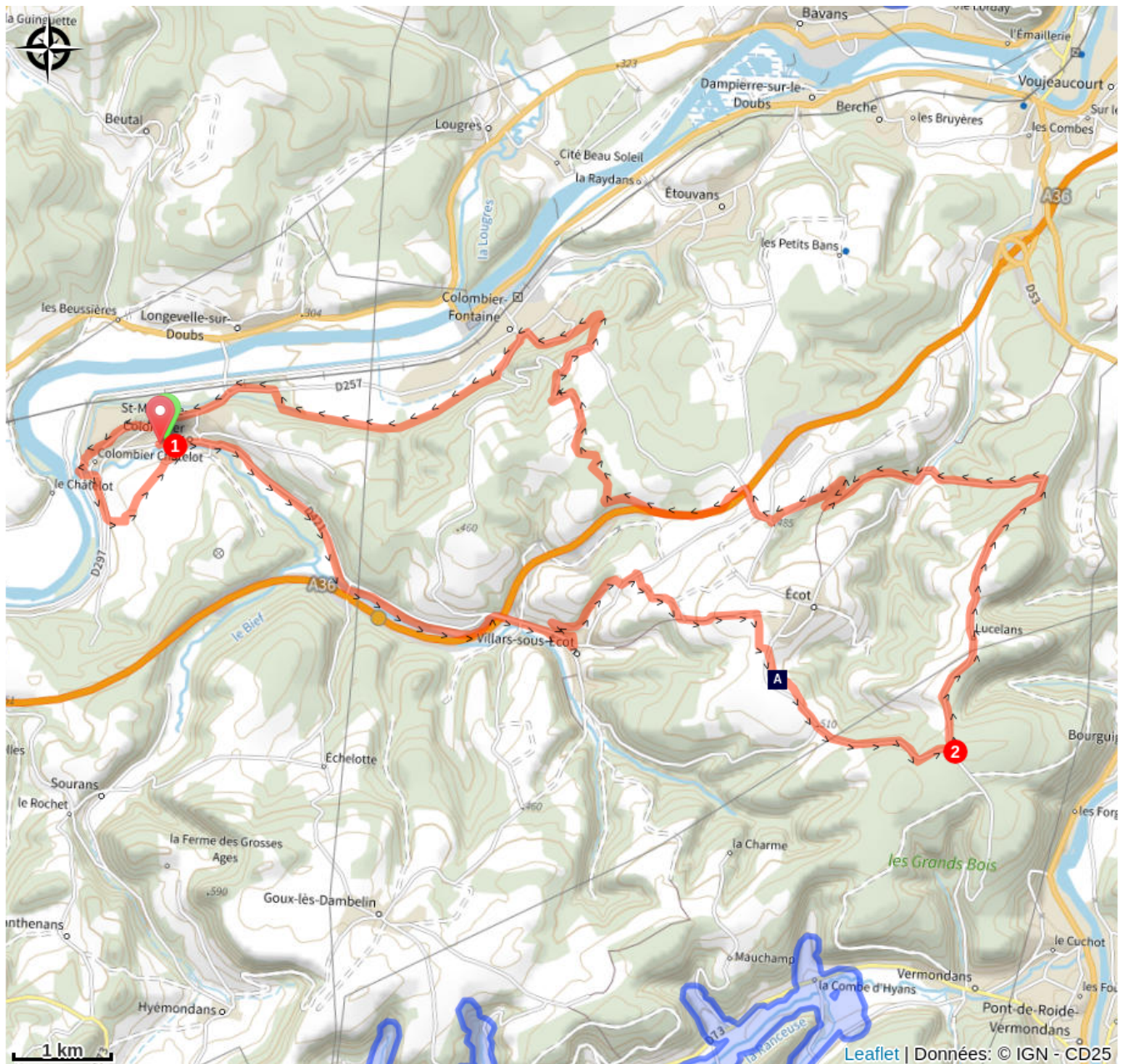
Chemin de la Mémoire et de la Paix (A)