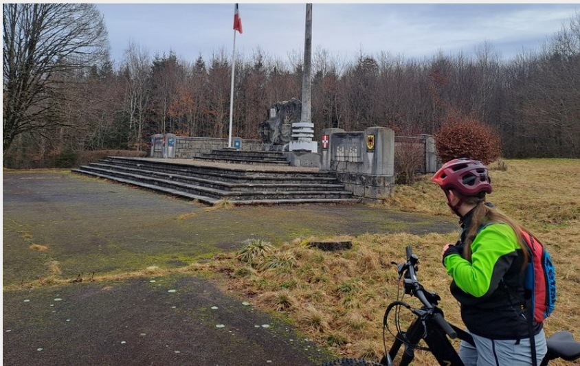
Mémorial de l'Écot