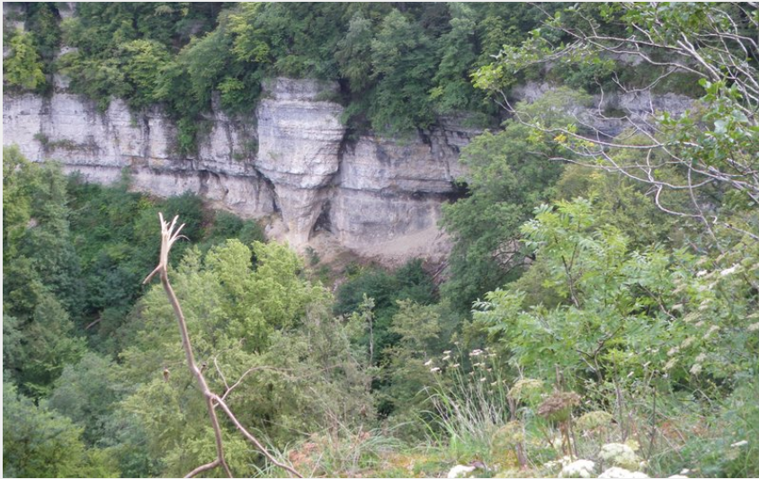
Point de vue du Dard (CCPSB)