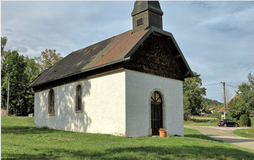
Chapelle du Saucet (CCPSB)