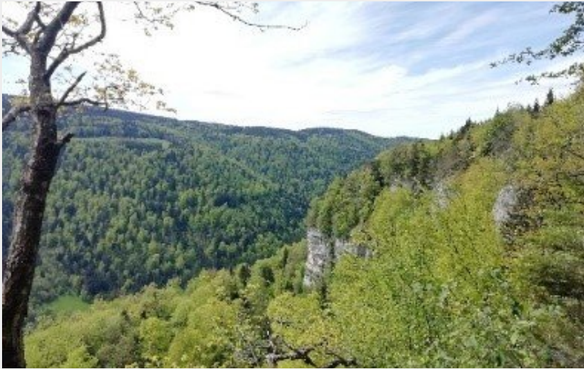
Creux de Hauteroche (CCPSB)