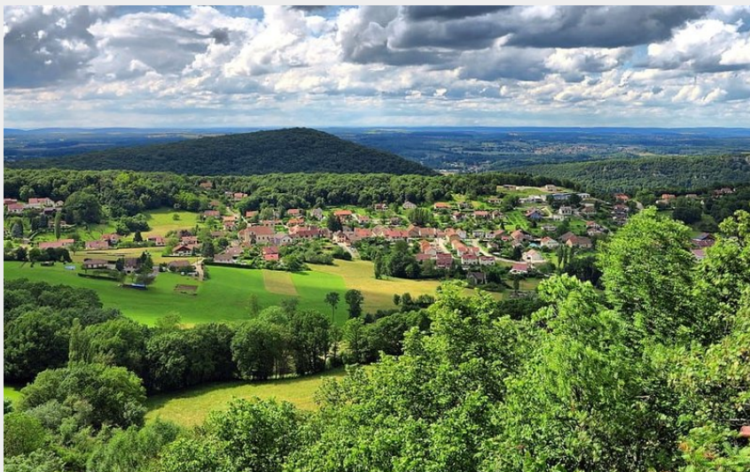
Vue de Vorges-les-Pins