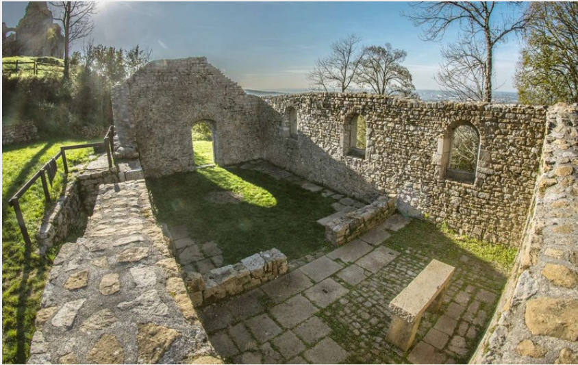
Ruines du bourg médiéval de Montfaucon