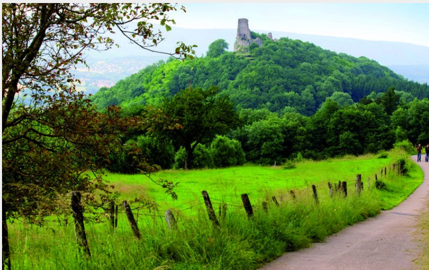
Vue sur le château de Montfaucon