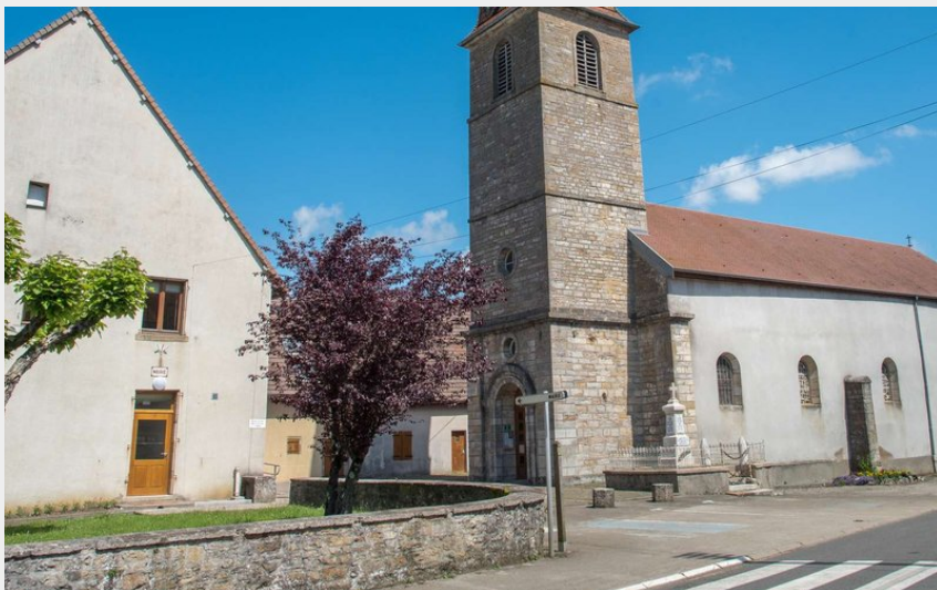
Église de Busy