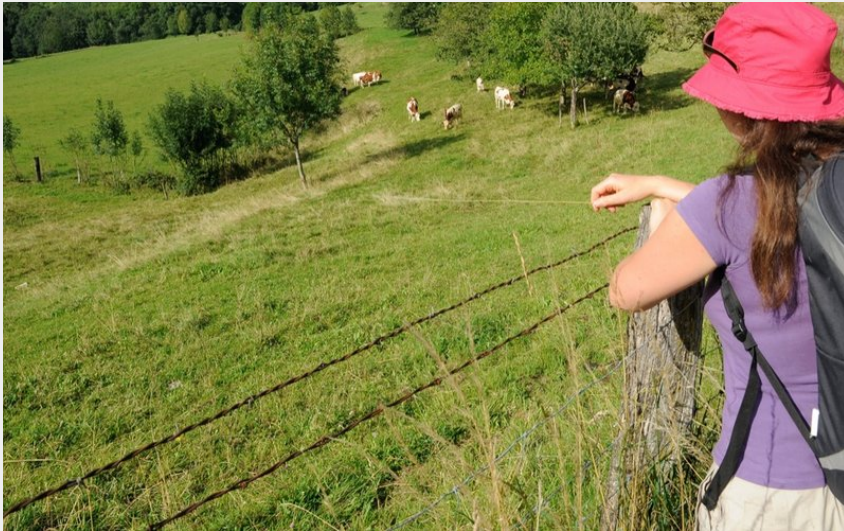
Vue du château de Montfaucon